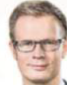
Af Benny Engelbrecht

transportminister (S), Frederiksholms Kanal 27 F, 1220 København K: